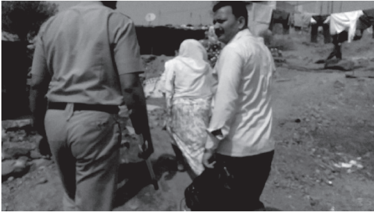
गुरुआई वर फौजदारी कारवाई

शेवटी मंगेश पाडगावकर यांच्या बुवाशक्ती निरूपण यामधील काही ओळी समाजाचं अचूक वर्णन करतात त्या अशा,