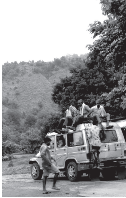
माझ्या गावाकडचा प्रवास

या अनेक समस्यांमध्ये अजून तीन समस्यांनी आपली जागा पक्की केली आहे. त्या म्हणजे वीज, रस्ते आणि दूरसंचारचे तीन तेरा वाजले आहेत. त्यामुळे जगाशी संपर्क जवळपास शून्यच.